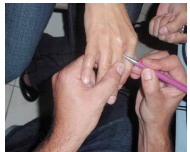
Testando con Supertronic